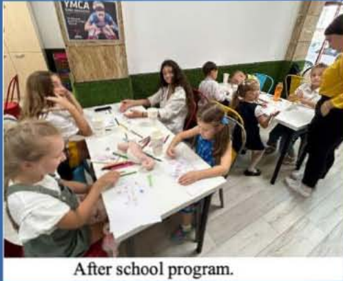
After school program.

チームワーク、リーダーシップ、コミュニケーションのスキルや能力を伸ばす機会を提供。