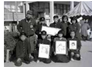
原爆の子の像建立運動