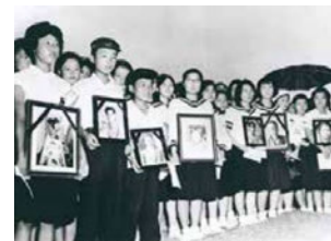
原爆ドーム保存運動