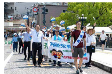
毎年8月4日実施の市民平和行進