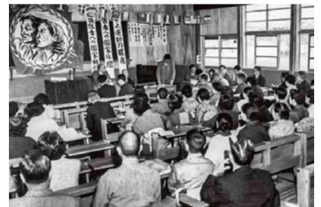
1956年5月27日 広島YMCAの講堂で広島県原爆被害者団体協議会発足

理事通信 12 月号は争いの絶えることのない世界で広島 YMCA の平和運動の歴史のほんの一部を紹介させていただきました。