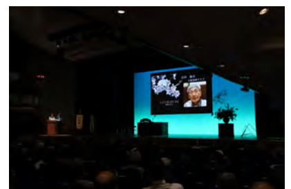
白井 春夫 ワイズ (大阪長野クラブ)