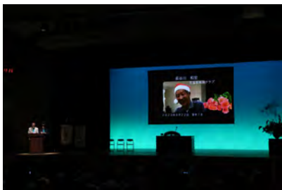
長谷川 和宏 ワイズ (名古屋東海クラブ)