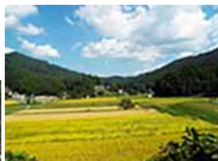
大阪府下とは思えない里山