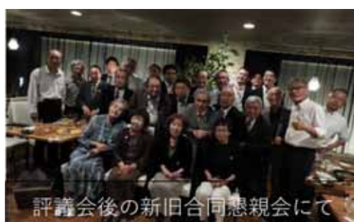
評議会後の新旧合同懇親会にて