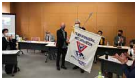
午前 直前第4回評議会での部旗の引継ぎ

議案は、事業計画案、予算案、次期京都部部会ホストクラブ承認および運営一任に関する件、ワイズデーに関する件の4つで、全てが滞りなく可決承認されました。