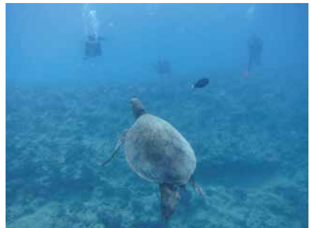
青く深く澄んだ海中で亀と一緒に撮影