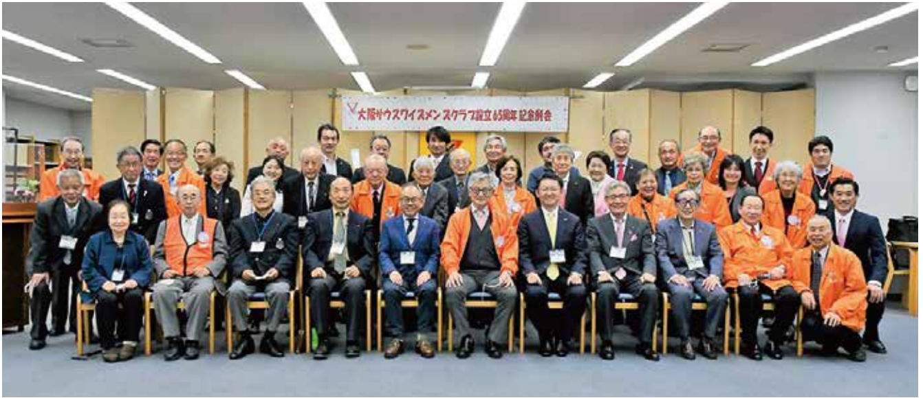
▲大阪サウスウイズメンズクラブ65周年記念例会 集合写真