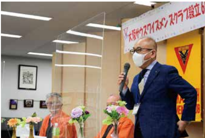
▲古田西日本区理事からの祝辞