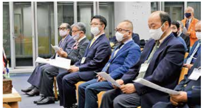
▲記念例会 来賓の皆様