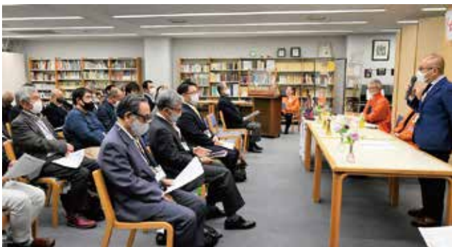
▲記念例会は厳粛に開催されました。