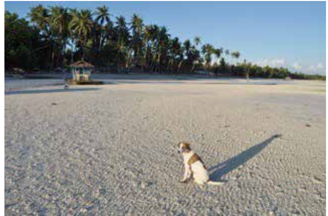
何処の浜辺でしょうか?

50年以上前、新婚当時二人で奄美大島へのダイビングが今でも最高に美しい海になりました。綺麗な海がどんどんと少なくなっていますが、海を守って行きたいものです。