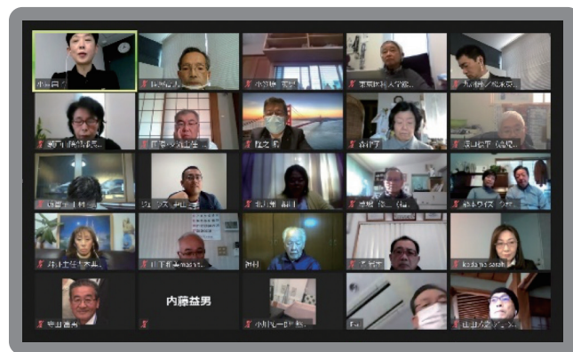
メネットアワー Zoom 参加の様子

講演内容から聞く日本の子どもたちの現状は、様々な事を考えさせられる内容でした。子どもは、大人の世界の影響をまともに受けるのだと学びました。よく「あの人は空気が読めない」と言いますが、これが子どもの世界に、人の顔色を見て判断し、自分の判断に自信を無くす世界をつくってしまい、人に合わせる事に疲れてしまう現状があるとは考えてもみませんでした。また、ネットの世界の発展によって、時間をかけて考える機会を失いつつあるのは、大人の世界でも同じです。そして、生活苦による子どもの困難や、未来への失望感があること、子どもの自殺にも影を落としていること（いじめは若年層自殺者全体の2%弱しかない）も知りました。子どもでいられる時間と世界を、いかに確保してあげられるかが大切だと教えられました。YMCAの働きもそのひとつではないでしょうか。私たちの世代が作り上げた世界です。私たちには責任があると痛感しました。改めて子どもたちとの関わり方の重要性を知る講演でした。これからのワイズ活動に活かしていきたいと思います。