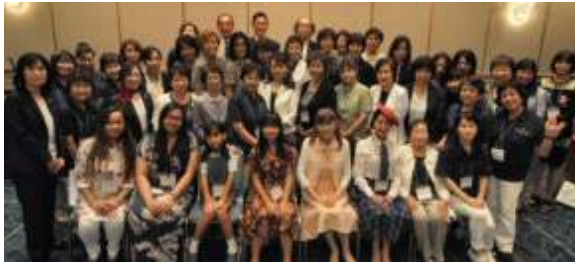
熱気の為にカメラも少しぼけています