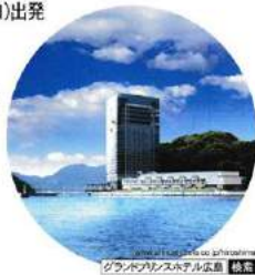
グランドプリンスホテル広島 広島