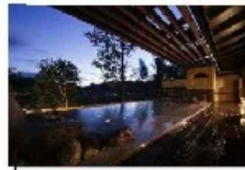
大浴場 奥の露天風呂【天守の湯】

日 時: 平成30年10月7日(日)午後3時～ (午後2時半受付開始、翌日朝晩各解散) 場 所: 姫路市夢前町前之庄187 夢乃井 参加費: 15,000円(一泊二食) (宿泊は一室6～8人の和室です)