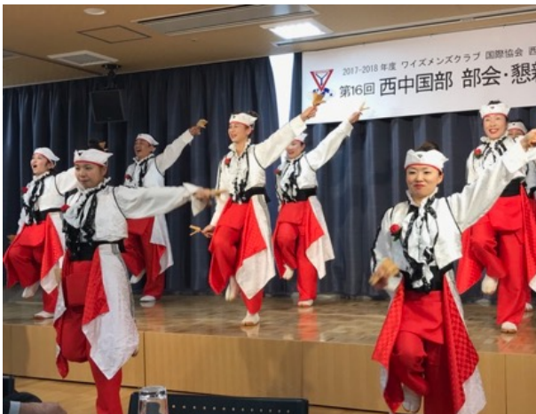
備後ばらバラよさこい踊り隊