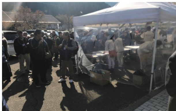
手作り感いっぱいの会場でした