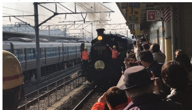
SL 北びわこ号に乗って会場へ

昨年から、びわこ部部会のアピール隊が「SL乗車、近江牛肉・松茸入りのすき焼き」を各部会にて約束されていたことがやっと実現しました。準備万端、心のこもった手作り感いっぱいのすばらしい部会でした。葦笛やチャーリー率いるバンド演奏も、会場を大いに盛り上げました。ご準備いただいた全てのみなさまに感謝いたします。