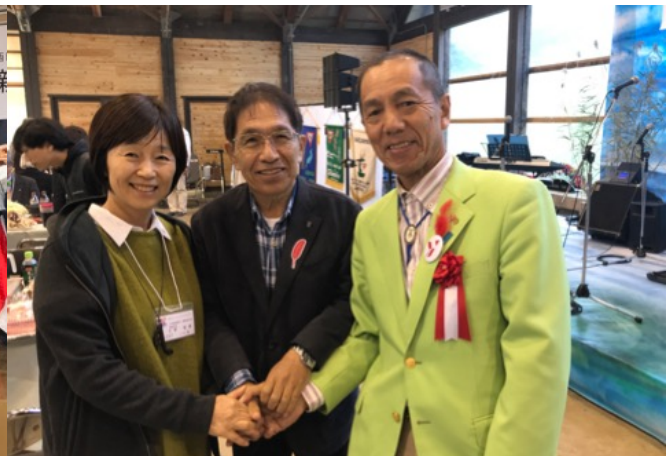
お疲れ様でした。(びわこ部部会にて)