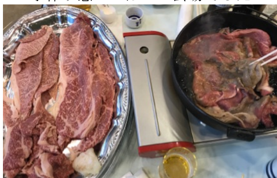
約束どおりの近江牛肉のすき焼き