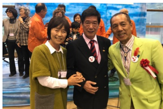
素晴らしいパフォーマンスでした！