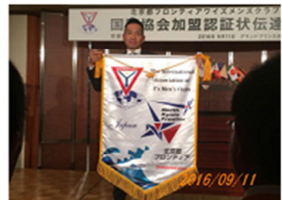
辻会長がバナー紹介