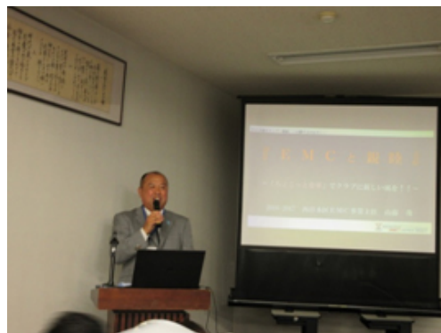
九州部EMCシンポジウムで講演