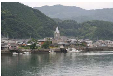
天草市河浦町の崎津集落

崎津集落を含む「長崎の教会群とキリスト教関連遺産」が国連教育科学文化機関(ユネスコ)の世界文化遺産登録の候補として、推薦された(7月25日)。