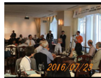
呉クラブ25周年懇親会