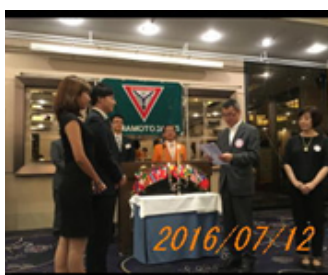
メネット同伴での入会式

8月4日～7日まで台湾での国際大会。8日はアジア会議に参加して参ります。報告は9月号でいたします。