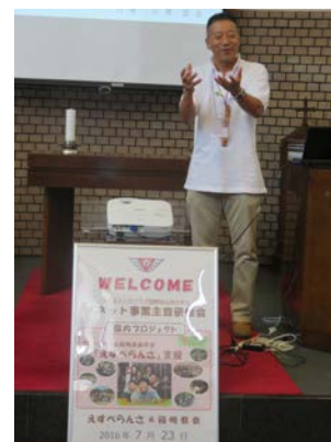
「えすぺらんさ」について 小田ワイズから聞く