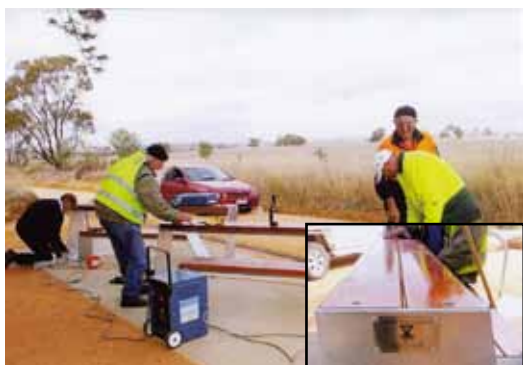
椅子の設置作業をしているベンディゴの会員とその椅子