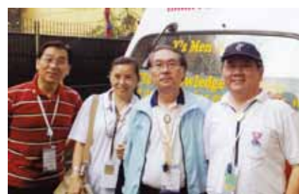
ラハキャンプの救急車の前で、ウィッチャン国際会長とボランティア

ラハーフィリピンズワイズメンズクラブは、マカティ YMCA と協働して「情報通になろう」と題して初歩の防災についての研修会を実施しました。