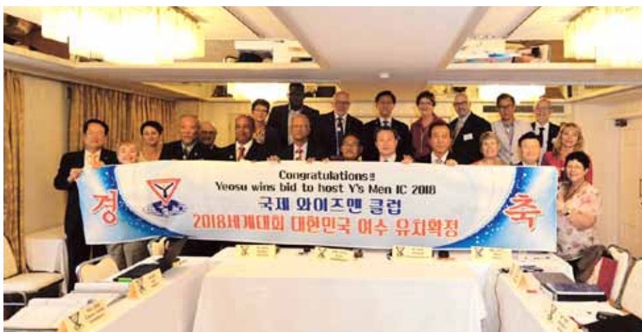
2018年の国際大会開催権を得た韓国代表団の歓喜に満ちた会員