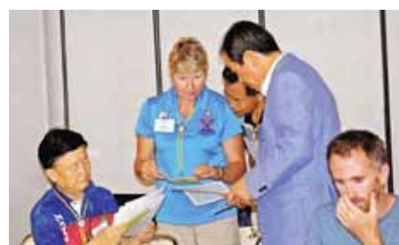
京都国際議会の様子 上段左:意見を述べる世界YMCA同盟YL担当国際事業主任ポール・ヘンリック・ハウ・ジェイコブソン 中央:2018年国際大会に関する議決を待っているアジアエリア会長エドワード・オング、韓国の国際議員と通訳者、ルーマニアの若い国際議員 右:同僚の国際議員と議論するジョーン次期国際会長 下段左:発表を行うヨーロッパエリア会長 中央:アイザック・パラシナル直前国際会長がウィッチャン国際会長に聖書と議長用棺を手渡す。右:ウィッチャン国際会長が、国際議会初日に新国際議員とエリア会長と次期エリア会長を正式に任命。