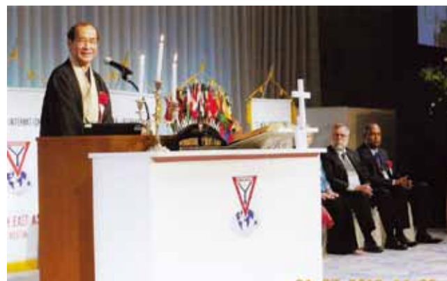
アジアエリア大会で挨拶をする京都市長(の挨拶)