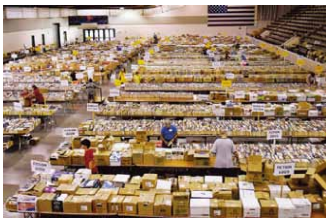
キャロンドレットで購入されるのを待っている本の山

2015 年度ブックフェアは、8 月の木曜日の 1 日を「内見会」とし、この日のみ入場は有料となりましたが、金曜日から月曜日までは、ブックフェアへの入場は無料でした。