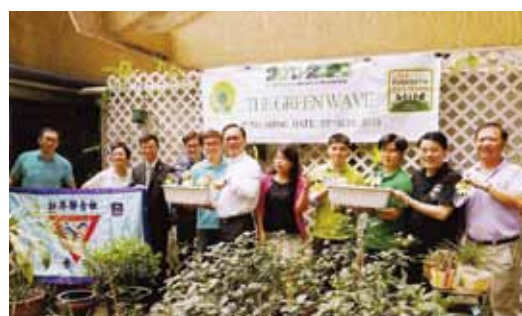
会場の1つに集まるワイズメンと(下)熱心な生徒達