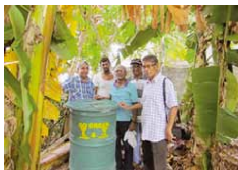
コンポスト容器近隣に届く

このプロジェクトの次の段階では、ゴミ管理と学童のコンポスト容器使用に関する教育プログラムも計画されています。