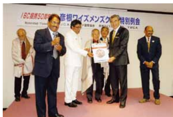
IBC 提携 50 周年特別例会で出された特別なポスターのお披露目

彦根クラブの公式祝典に出席する為にハイデラバードからやって来た多くのリーダーは、様々な機会を捉えて彦根とそれ以外の日本の都市を訪問し、日本の友人の皆様のおもてなしを満喫しました。私は、彦根クラブと沼津クラブとの IBC 締結 50 周年式典に出席し、つい最近ハイデラバードに戻って来たところです。