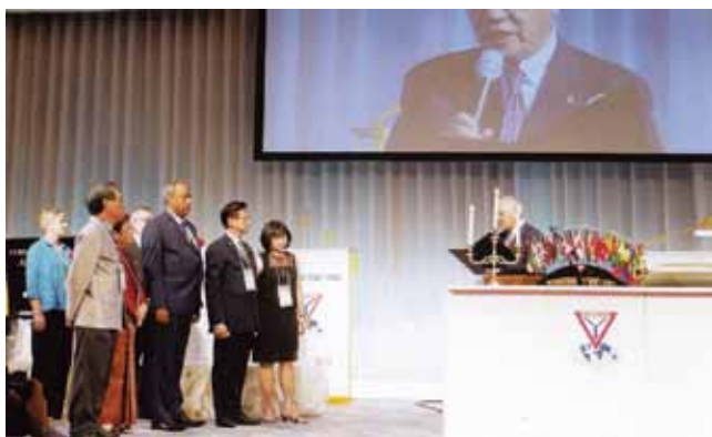
藤井寛敏元国際会長による国際会長とアジアエリア会長の就任式