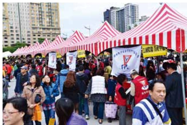
2014 年のチャリティーバザーの 1 シーン

今年は 130 人の子供達が授業に出席しています。授業は、週 3 時間、年 48 週行われます。これまでに、300 人以上の子供達がこのプログラムの恩恵を受けました。中には 2 回も 3 回も受講する子供もいます。