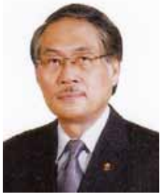
2015/16 国際会長 ウィッチャン・ブーンマバジョン

親愛なるワイズ運動の同志の皆様へ ワイズメンズワールド(YMW)誌の紙面を介して皆様とお会いし、過去から現在に至る尊敬すべきリーダーの皆様と共にワイズメンズクラブ国際協会からのご挨拶を申し上げることは私にとって大きな喜びです。