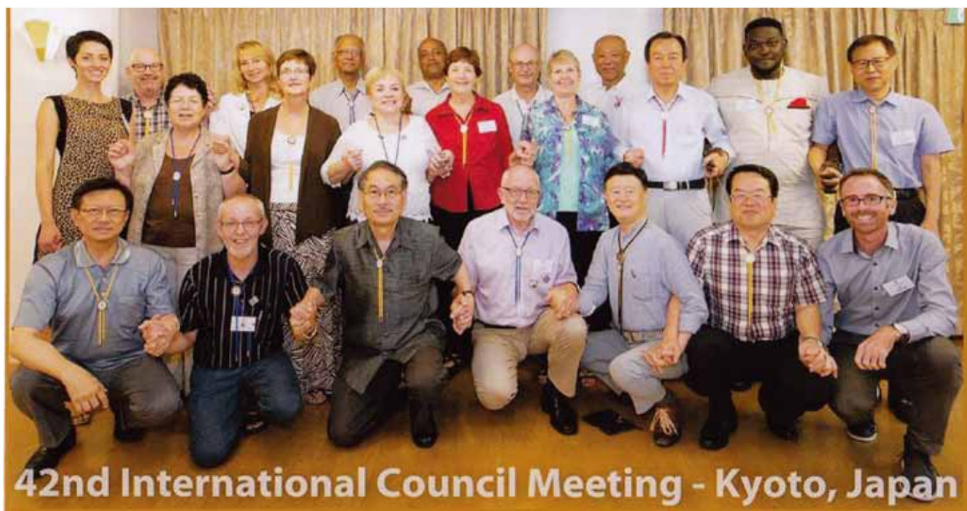
2015年8月、日本の京都で開催された国際議会の出席者