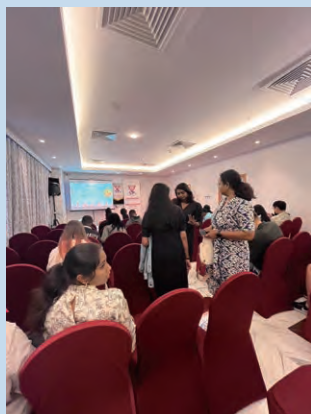
クロージングセレモニー直前