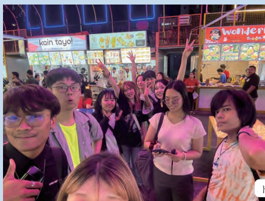
ドバイでの交流のひと時