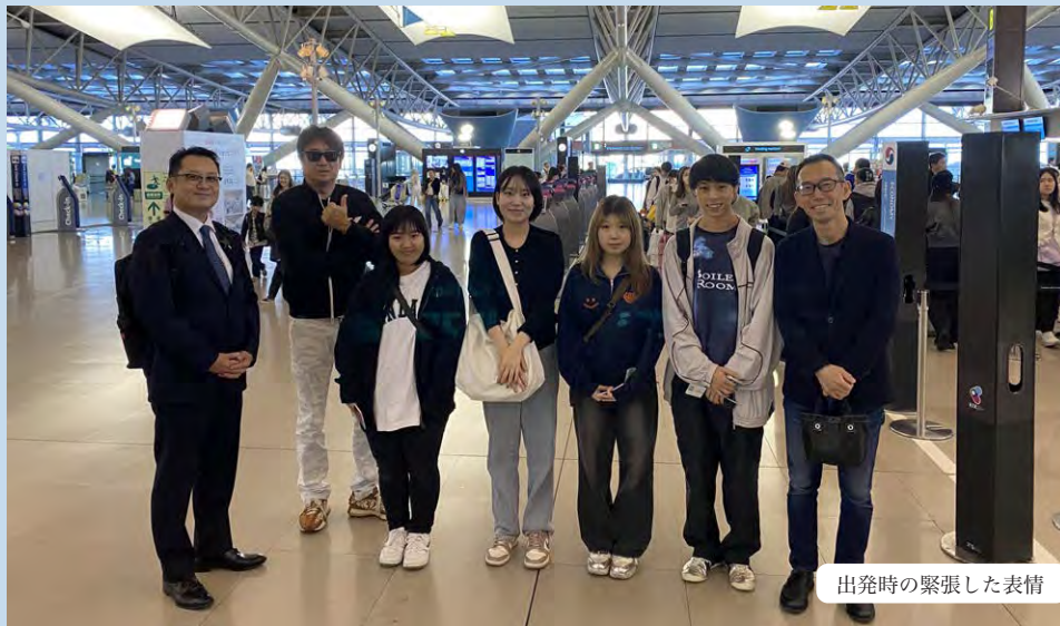
出発時の緊張した表情