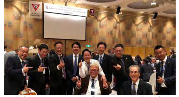
京都キャピタルクラブ 40 周年記念例会