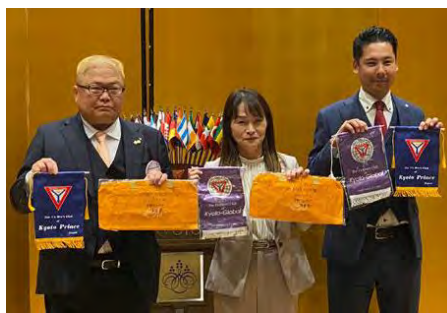
3クラブ合同例会(京都プリンス・京都ウェル)