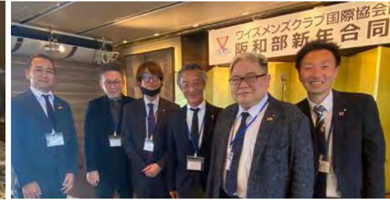
阪和部新年合同例会