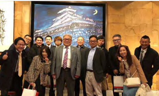
熊本クラブ DBC 交流