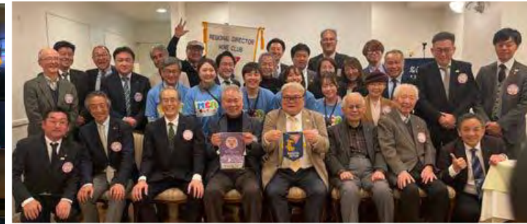
名古屋クラブ例会