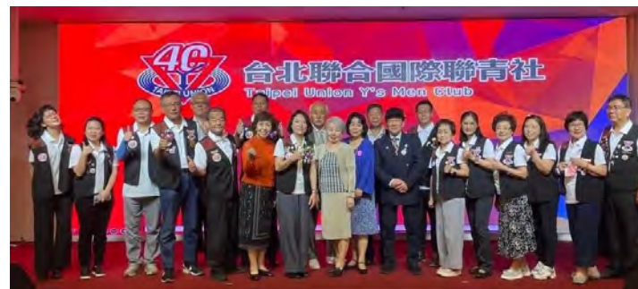
②台北ユニオンクラブ設立 40 周年記念例会