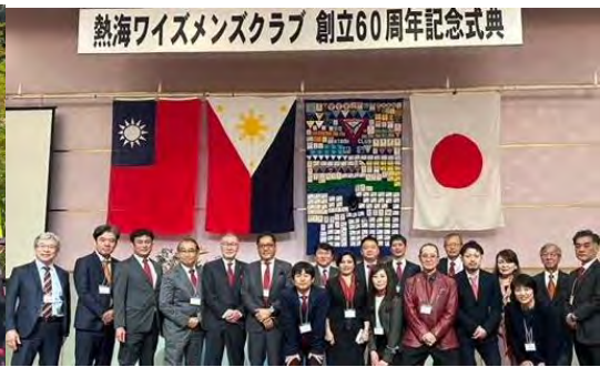
熱海クラブ設立 60 周年記念例会