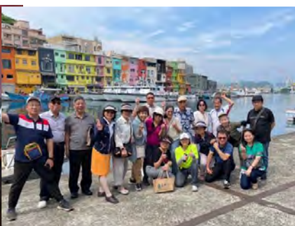
②正濱漁港北側正濱路にて