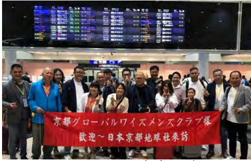
台中エバーフロークラブ IBC 交流