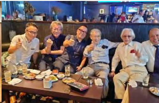
二次会?三次会??四次会????