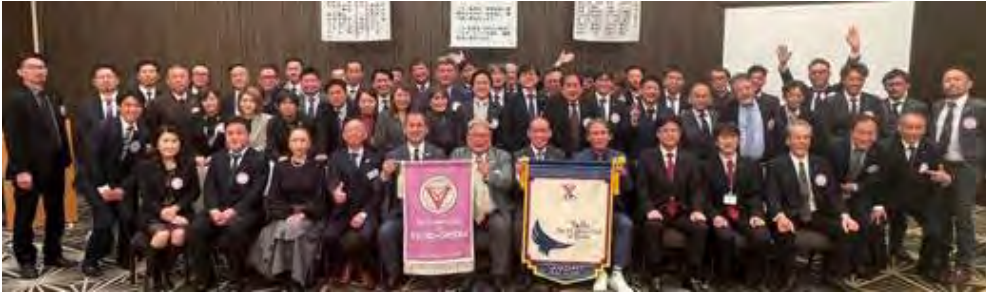
京都トゥービークラブと前期西日本区最優秀クラブ賞同時受賞祝賀会合同例会