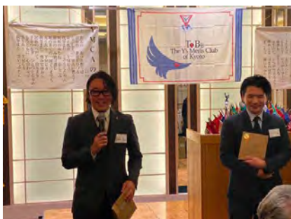
京都トゥービークラブ例会