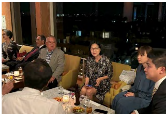
東京クラブ、台北クラブと団らん

・11月3日(金)~4日(土) DBC・IBC合同フェロウシップアワーとエクスカーション