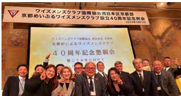
京都メイプルクラブ 40 周年記念例会