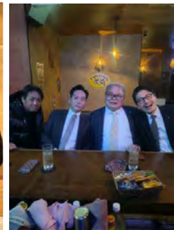
北京都フロンティアクラブ例会