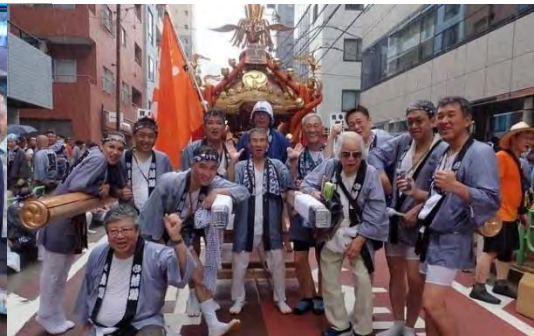
富岡八幡宮例大祭(水かけまつり)