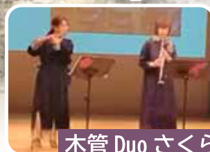
木管 Duo さくら