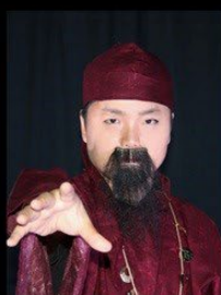
うまやどのみこ 厩戸皇子