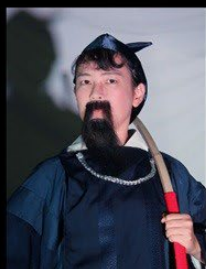
もののべもりや 物部守屋