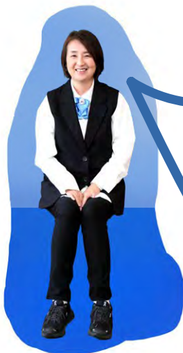
西日本区 地域奉仕・環境事業主任