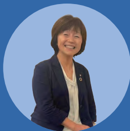
メネット委員会代表