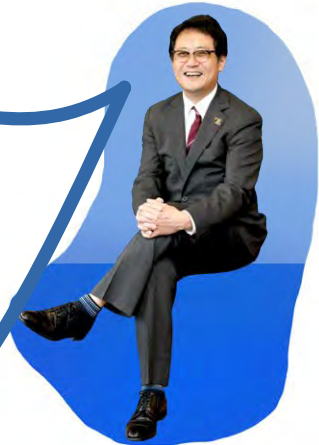
西日本区 Yサ・ユース事業主任

新年あけましておめでとうございます。 自然災害や紛争が続く中、ワイズとYMCAにつながるユースの活動は再び明るく活発になりました。新しい年はYMCAに求められる働きをYYYで考える年となることを期待します。 ユース世代が生涯にわたる自身への学びの場、宝を積み上げる場となり、提案することが事業主題の“Through The Past, Darkly”の実現に繋がります。2025年は明るい未来に向けての第一歩の年となりますように祈ります。