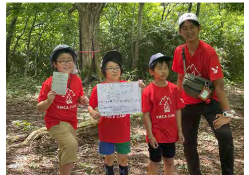
リフレッシュキャンプ