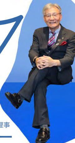
西日本区次期理事

新春の侯、皆さまにはご健勝にて新年をお迎えのこととお慶び申し上げます。『寄り添う。忘れない。』が小生のテーマです。巳年は新しい挑戦や変化に対して前向きな姿勢を示す年と言われています。次の世代を担う若者たちにもより良い未来になります様に挑戦して参りましょう。ご一緒に素敵な一年に致しましょう。