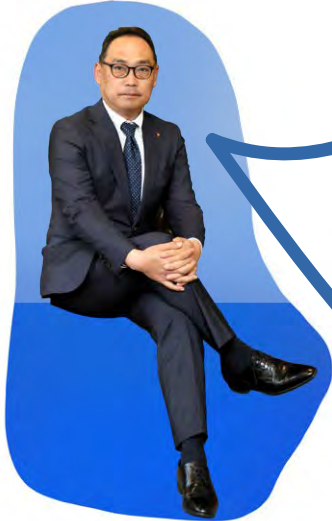
西日本区 EMC 事業主任