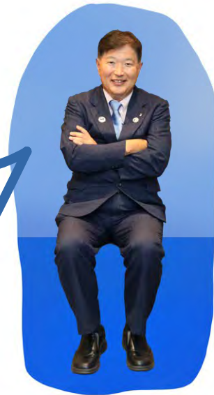
西日本区 国際・交流事業主任

新年あけましておめでとうございます。令和七年を迎え、いよいよ鵜丹谷理事期も残り半分となりました。今期は、新入会員拡大目標数を 150 名としてます。半期が終わり 75 名の目標数に対して、実際の入会者数は 10 名ちょっと足りていません。多くの入会者を迎えた部があれば、そうでない部もあります。持続的なワイズ活動のため、残り半期引き続き積極的な仲間を増やす活動をお願い致します。