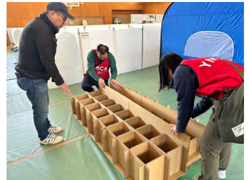
水害ボランティア(町野)

同じ災害は二つとありません。能登半島の地形や環境もあり復興への道のりは長期化が必須です。YMCAでは今後もワイズメンズクラブのみなさんと共に出来ることを懸命に行っていきます。