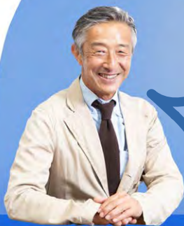
西日本区直前理事