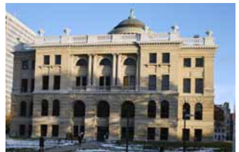
左：アレキサンダー判事が子供の頃参列したトレドにある教会 中：トレドの郊外、マウミーにあるアレキサンダー判事が子供のころ住んでいた家 右：ポール・ウィリアム・アレキサンダー判事が判事として務めたトレドのルーカス郡裁判所