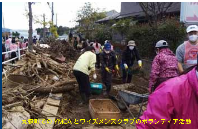
九森町でのYMCAとワイズメンズクラブのボランティア活動

YMCAでは、お互いに支え合い、 助け合う中から生み出されるエネルギーを、 地域の希望に変える働きを進めています。