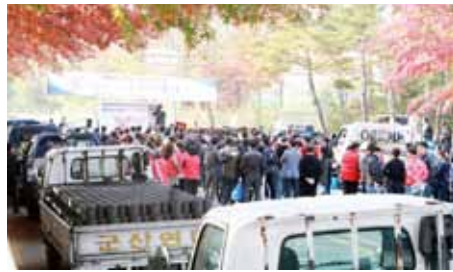
配給事業の前の広場での集会