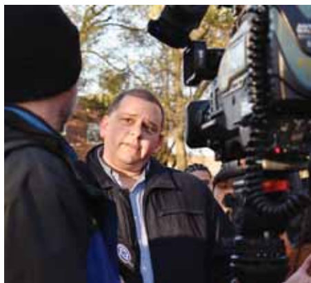
公園の奉献の後、テレビカメラに向かって語るトレド市長ワード・カプツキエビッチ氏