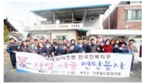
全北区の笑顔のボランティア