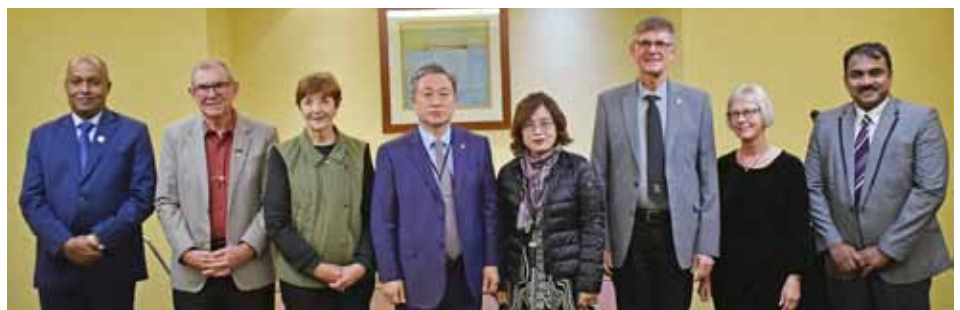
左：ジェイコブ・クリステンセン次期国際会長に襟ピンを付けるジェニファー・ジョーンズ国際会長 右：役員とそのパートナー達、左から、フィリップス・チェリアン国際会計、ラッセル・ジョーンズとジェニファー・ジョーンズ国際会長、ムン・サン・ボン直前国際会長とリ・ハイ・ソック夫人、ジェイコブ・クリステンセン次期国際会長とランディ夫人、ジョース・ヴァルギース国際書記長