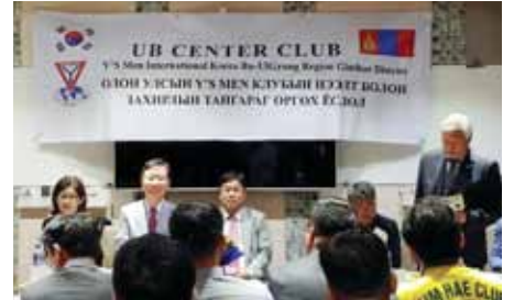
ウランバートル中央クラブの集まり

奉仕の忙しいスケジュールに拘わらず、時間を都合して、モンゴルでのワイズの養成・強化プログラムを実施しました。同国では、最近、ウランバートル中央クラブとホブドクラブがチャーターされています。ウランバートル中央クラブは32名でチャーターしましたが、現在45名に増加、ホブドクラブは22名でスタートしましたが、88名となっています。