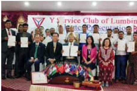
クラブチャーター認証書授与の後にルンビニクラブのメンバーと