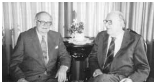
デンマークにおける「ワイズダムの父」エイナー・ダービッドセンとニールズ・ヴァス・ジェンセン(1966年)

ワイズメンズクラブのアイデアはオールボーからデンマーク全土とノルウェーに広がり、1958年にノルウェー