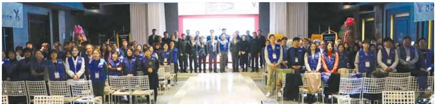
ジャンボ クラブ：韓国エリアでの極めて異例な会員獲得キャンペーンの中で、新クラブ、ギムヘー・ヘルパーズハイ・ワイズメン & ワイズウィメンズクラブが 12 月 8 日の創立者の日に、100 日間のキャンペーン挑戦期間の最終日に創設され、その新たな高みに到達した。この新クラブは、医師、看護師、医療事務従事者達から構成されていて、IPIP ムンによって入会式が行われた。これは、すべての参加している医師たちがその医療活動を通じて真のボランティア精神にコミットしているため、YMI の医師プログラムにとって確実な会員増強を後押しするものである。