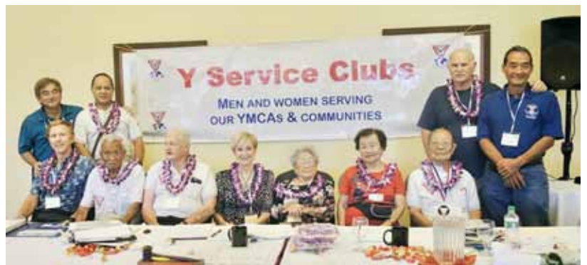
東カウアイ Y サービスクラブの会員