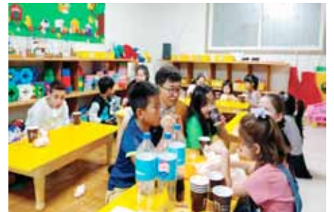
光州アルファクラブのワイズメンと子供たちに贈られたプレゼント