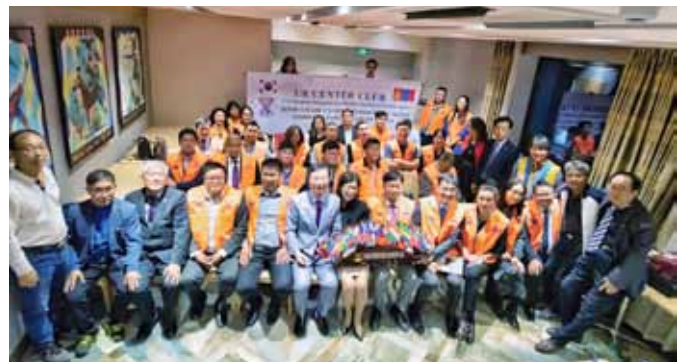
韓国ワイズ医師団とウランバートル中央クラブのメンバー