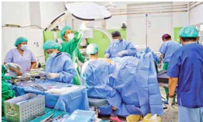
医療従事者は高度医療に従事

地元の医療設備や器具が劣るため難しい作業でしたが、行った各種の手術は、ワイズの医師団のおかげで成功裡に達成されました。一行は、韓国から持参した US$23,300 相