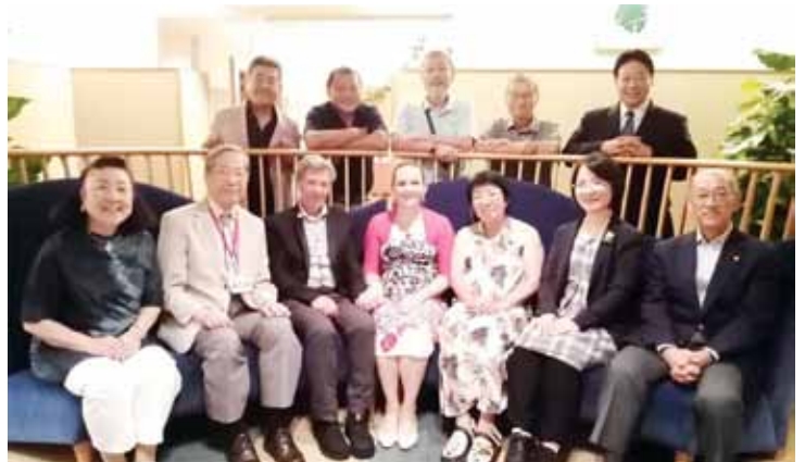
ホストとパルヌからの訪問者達

姉妹活動によってクラブを支援するため、YMCA は、日本のクラブの活動に重要な役割を果たしていると見られます。募金と文化イベントの促進は、日本とエストニアのワイズメンズクラブの共通の目的です。YMI の一員であることの2つの利点が挙げられました。