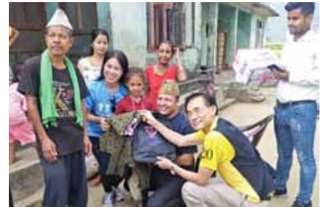
子どもたちとスタッフと養護施設の前で