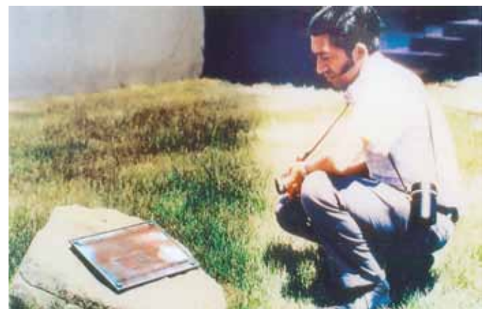
1920 年に最初のワイズメンズクラブが設立された YMCA のサイト。その後取り壊されてしまったが、その場所は標識で記録されていた。