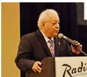
開会式の司会を務める ポビー・スティバース・アピキ 米国地域会長