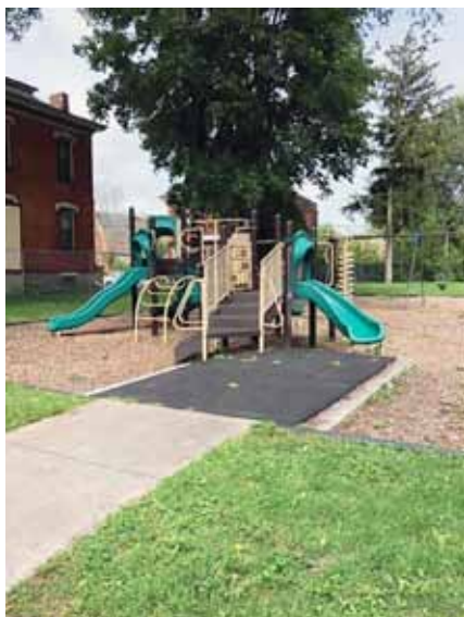
公園にある子供用遊具