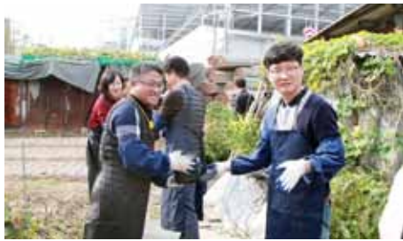
貧しい家庭に練炭を配る