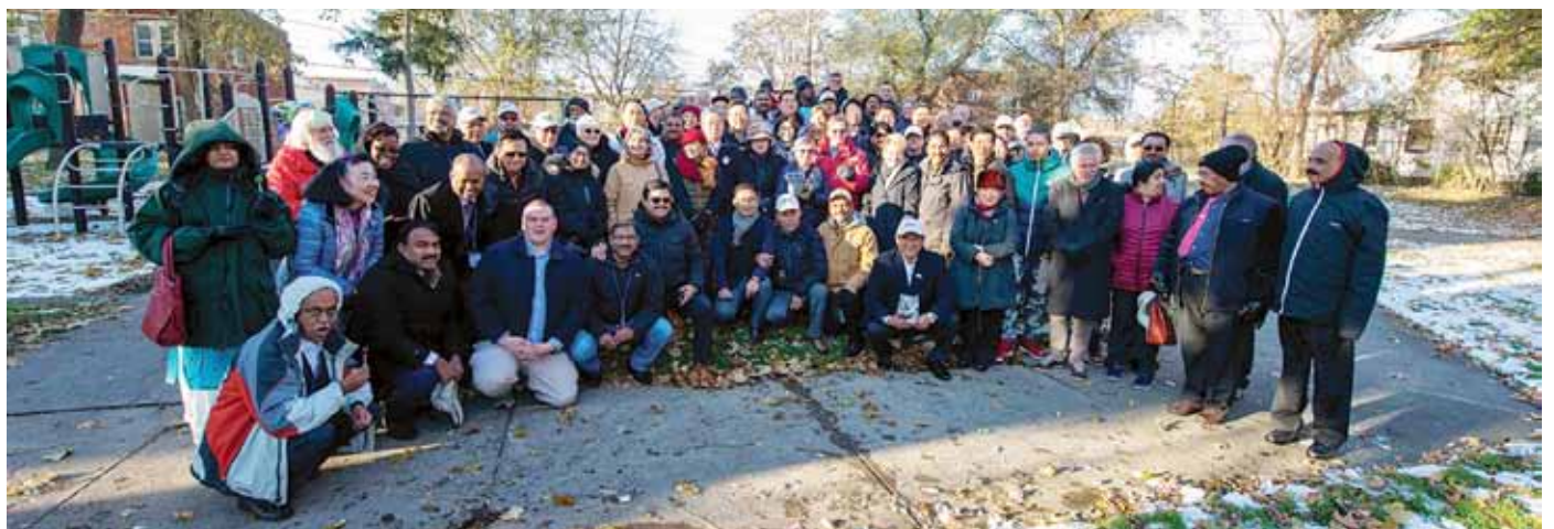
奉献式の後の公園にて参列者の記念写真