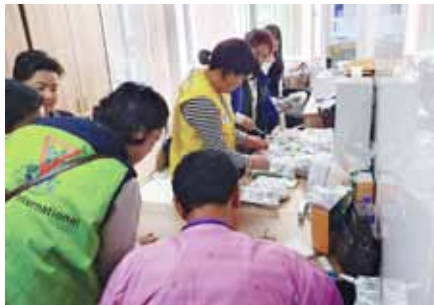
患者の診察手続きで大忙し

23名からなる医療チーム一行は、キュン・ヒー中央病院からの6名の医師を含めたチームで、現地で1,210名の患者の診察をし、麻酔医療を必要とする15回の手術を、1週間の内に行いました。ワイズの医師団が高い技術力をもっているおかげで、1日平均250名もの人々を診察、治療することができました。