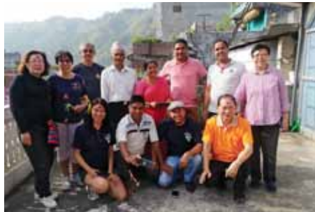
訪問者とネパールの家族