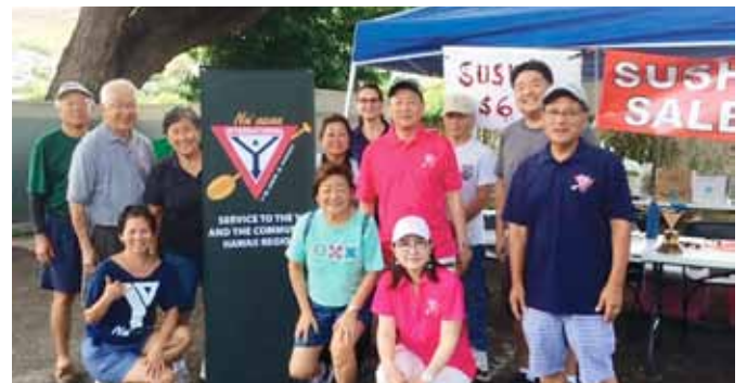
お客さん待つメンバー

販売チーム(ホノルル - ヌアヌワイズメン & ウィメンズクラブのメンバー達) 理証明書の保持者が1名と、イベント許可証も必要です。