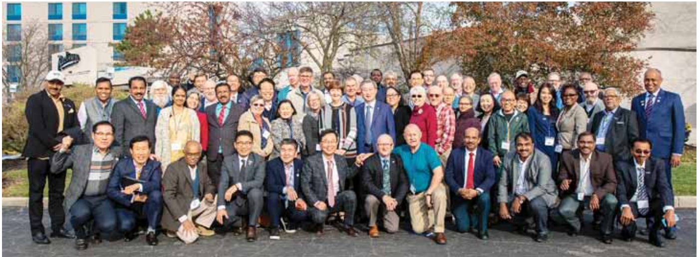
トledoサミットの参加者たち