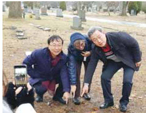
以前と今:(左) 2019年1月、ムン国際会長とポール・ウィリアム・アレキサンダー遺産プロジェクトの共同委員長がアレキサンダー判事の遺灰が埋葬された場所を特定。(右) 2019年11月、その場所に新しい墓石を設置

デビー / チャーリー・レドモンド夫妻が、2台のバスに分乗した参加者に、トレード市内のアレキサンダー判事の生涯(1888-1967)を物語る場所を案内しました。