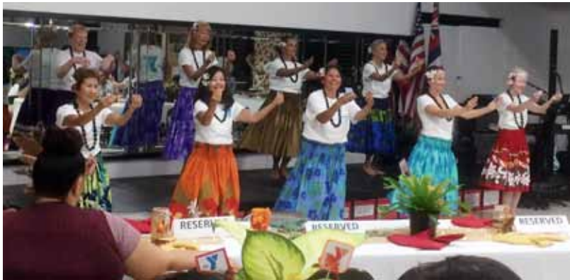
ワイキキセトルメント YMCA のオープンハウスを祝って

スクラブは、1963年4月5日にチャーターされ、一貫して若いメンバーを入会させることができています。現在、会員の50%は40歳未満です。