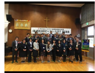
ニューメンバー26名