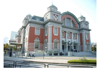
中之島・中央公会堂

— ころ豊かにワイズ活動を展開し、ワイズスピリットをつないでいく — — Promote the Y's movement thoughtfully and hand down the Y's spirit —