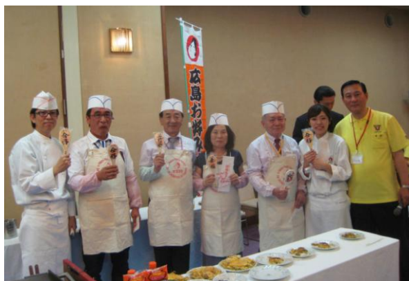
9.29 西中国部 部会にて広島焼きにチャレンジ