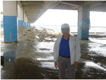
相馬原釜町の港(福島県)