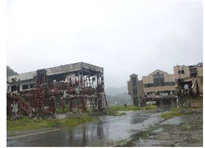
大辻町の地盤沈下(岩手県)