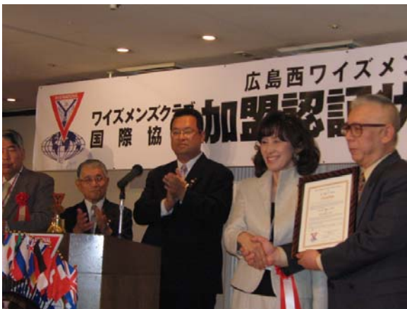
広島西クラブチャーターナイト (5月24日)

理事主題 「思いやりを持ってワイズライフを！」 - わかち合いは微笑みをもって - “Enjoy Y's life with Consideration!” - Share with a smile -